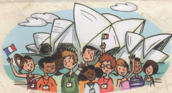
Journées mondiales de la jeunesse à Sydney, en Australie.