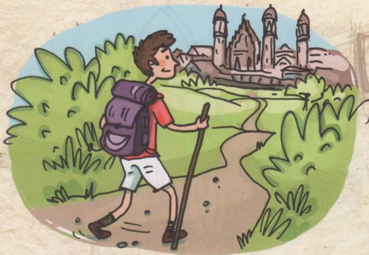
Pèlerinage à Saint-Jacques de Compostelle, en Espagne.