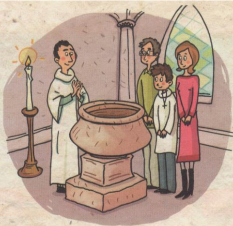
Baptême d'un jeune en France.