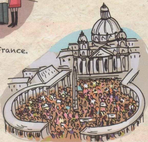
Rassemblement de fidèles sur la place Saint-Pierre à Rome, en Italie.